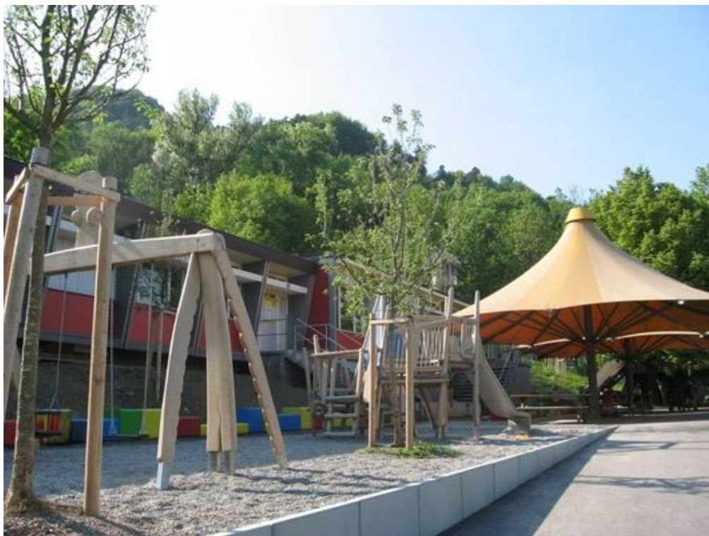
Das GZ Leimbach soll zügeln.