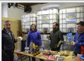
An diesem kalten, regnerischen Morgen kam das leibliche Wohl nicht zu kurz.