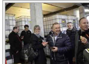
Es wurde eingehend über das interessante Projekt informiert und diskutiert.