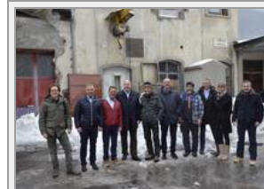
Lauter zufriedene und fröhliche Gesichter zum Abschluss der interessanten Medienorientierung.