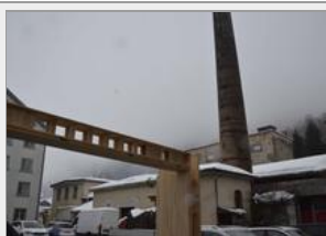
Der markante Kamin muss dem neuen Projekt nicht weichen.