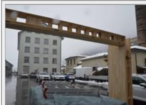
Hergestellt aus einheimischen Buchenholz.