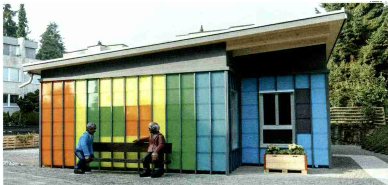
Die Unterkunft mit der Fassadengestaltung der Künstlerin Rita Ernst sowie dem farbenfrohen Kunstwerk von Stephan Schmidlin.

Themen-Nr.: 232.007 Abo-Nr.: 1080109 Seite: 26 Fläche: 41'750 mm 2