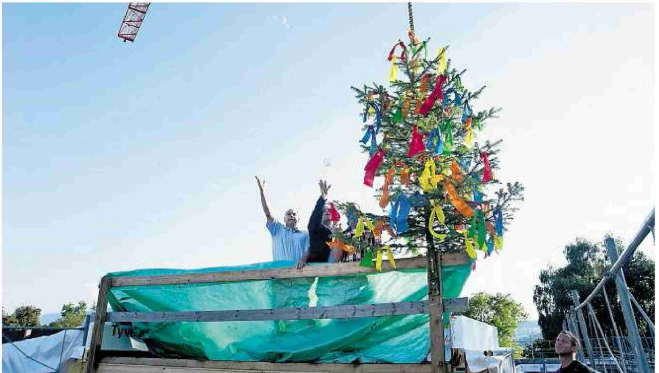
Fliegende Gläser: Vertreter der Baugenossenschaft Zurlinden und der Zimmerei Diethelm segnen den neuen Bau.

MEILEN. Für eine Überbauung mit 25 Genossenschaftswohnungen an der Dollikerstrasse feierten kürzlich die Baugenossenschaft Zurlinden und die Gemeinde Meilen Aufrichte.